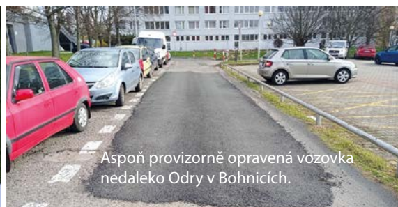
Aspoň provizorně opravená vozovka nedaleko Odry v Bohnicích.