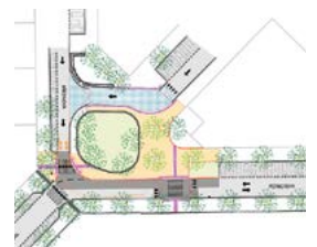
Návrh úprav křižovatky Pernerova × Březinova