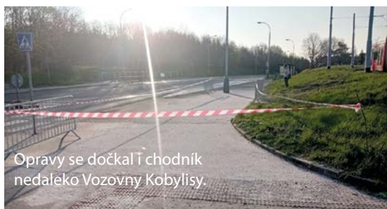
Opravy se dočkal i chodník nedaleko Vozovny Kobylisy.

Pokud víte o nějakém dalším místě, které vyžaduje opravu, určitě nám dejte vědět na info@8zije.cz, ideálně s fotkou místa a jeho okolí pro zorientování. Rádi to za vás předáme k vyřešení.