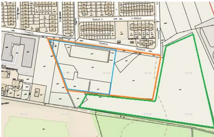
Modrý obrazec označuje rozlohu původního pozemku, oranžový současný stav.

Není bez zajímavosti, že hned sousední pozemek, který se nachází blíže elektrické rozvodně, vlastní další developerská společnost NAXXAR Consult s.r.o. (na přiložené mapce je vyznačen zeleně). V současné době se podle platného územního plánu jedná o městskou krajinnou zeleň, stavět se zde tedy nesmí. Existují však samozřejmě cesty, jak územní plán změnit, zejména máte-li na své straně vstřícného radního.