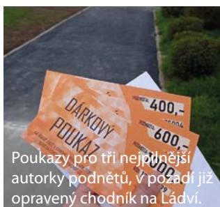
Poukazy pro tři nejpilnější autorky podnětů, v pozadí již opravený chodník na Ládví.