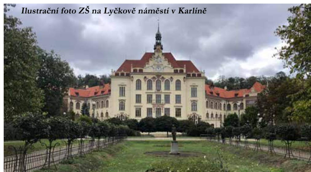
Ilustrační foto ZŠ na Lyčkově náměstí v Karlíně

Jedním z důležitých témat, kterým se Osmička žije liší od ostatních stran, je důraz na kvalitu škol. Ostatní si buď myslí, že je vše v pořádku, nebo by rádi zlepšovali, ale nevědí jak.