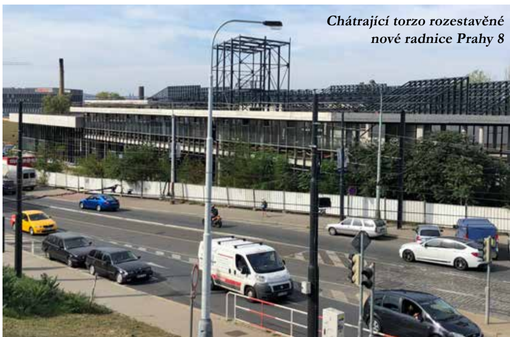
Chátrající torzo rozestavěné nové radnice Prahy 8

Osmička žije dlouhodobě kritizuje hospodaření radnice, poukazuje na podezřelé praktiky v nakládání s majetkem a naposledy jasně vystupovala proti schválenému rozpočtu.