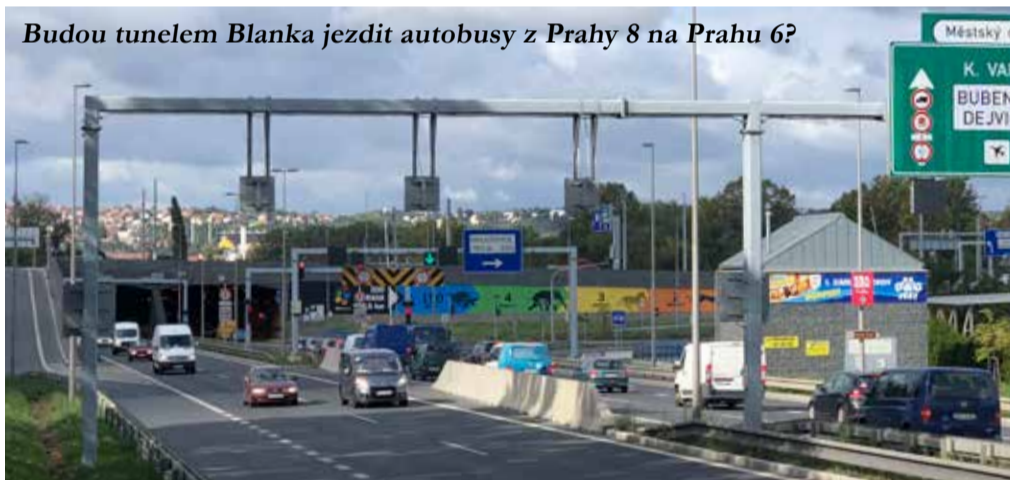
Budou tunelem Blanka jezdit autobusy z Prahy 8 na Prahu 6?

Každý ví, že naše městská část patří z hlediska dopravy k těm nejvíce zkoušeným. O důsledcích ani není třeba mluvit – znečištěné ovzduší, hluk a prach. Na mnoha místech nelze kvůli zaparkovaným autům ani projít po chodníku. Rodiče vozí děti do školy autem ze strachu, aby je někde nesrazilo jiné auto.